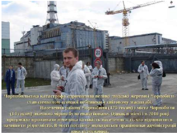
Чорнобильська катастрофа спричинила великі людські жертви і Чорнобиль став символом атомної небезпеки у світовому масштабі. Населення району Чорнобиля (175 тисяч) і міста Чорнобиля (14 тисяч) значною мірою було евакуйоване. Однак в місті і в 2010 році продовжує проживати невелика кількість населення — ті, хто відмовився залишити рідне місто. В місті постійно знаходяться працівники адміністрації зони відчуження.

Міжнародна група екологів з Білорусі, Європи і США прийшла до висновку, що майже через 30 років після катастрофи на Чорнобильській АЕС