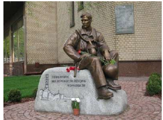
Пам'ятник пожежникам у Києві