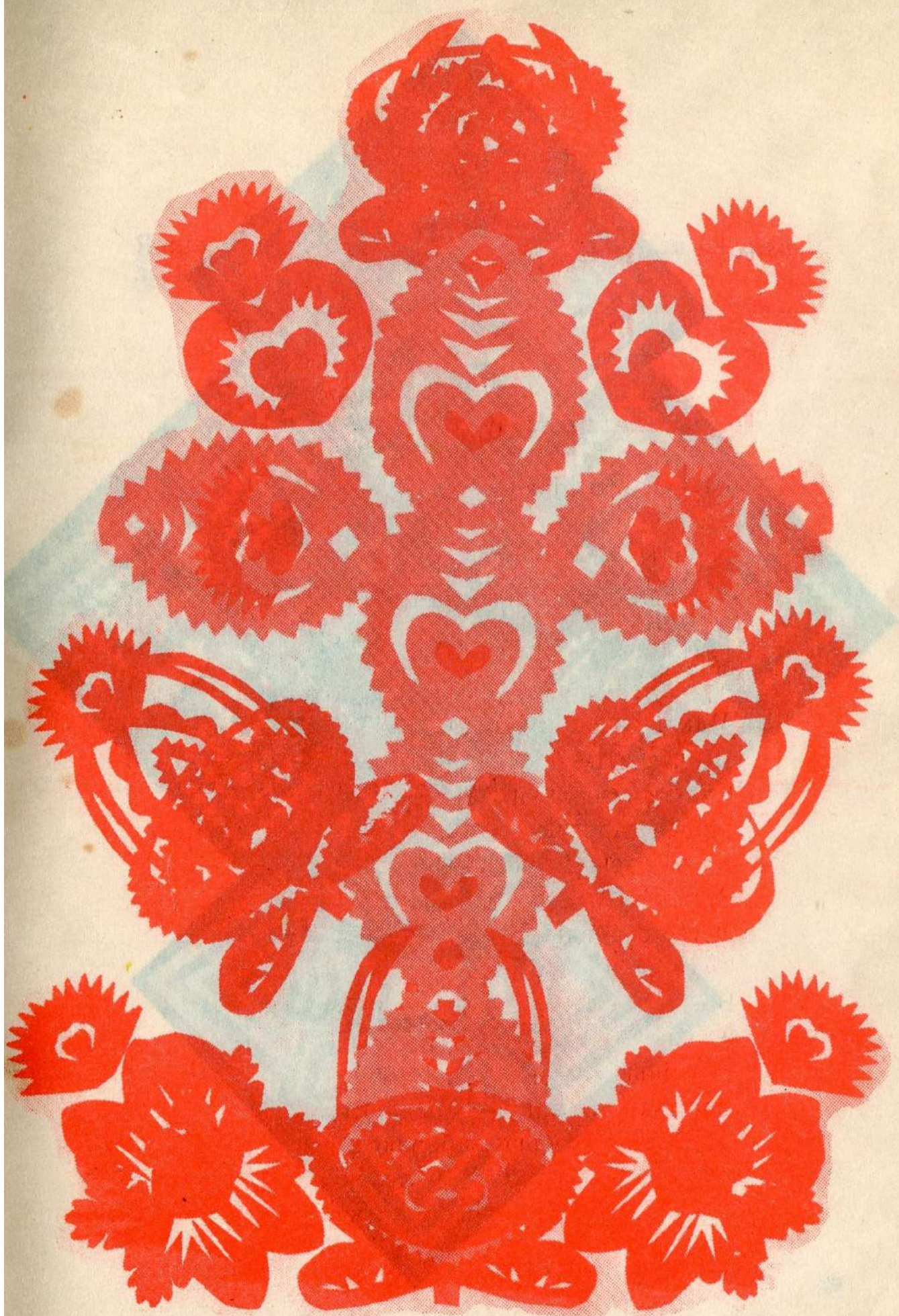
Витинанка "ВЕСІЛЬНЕ ПЛЪЦЕ"