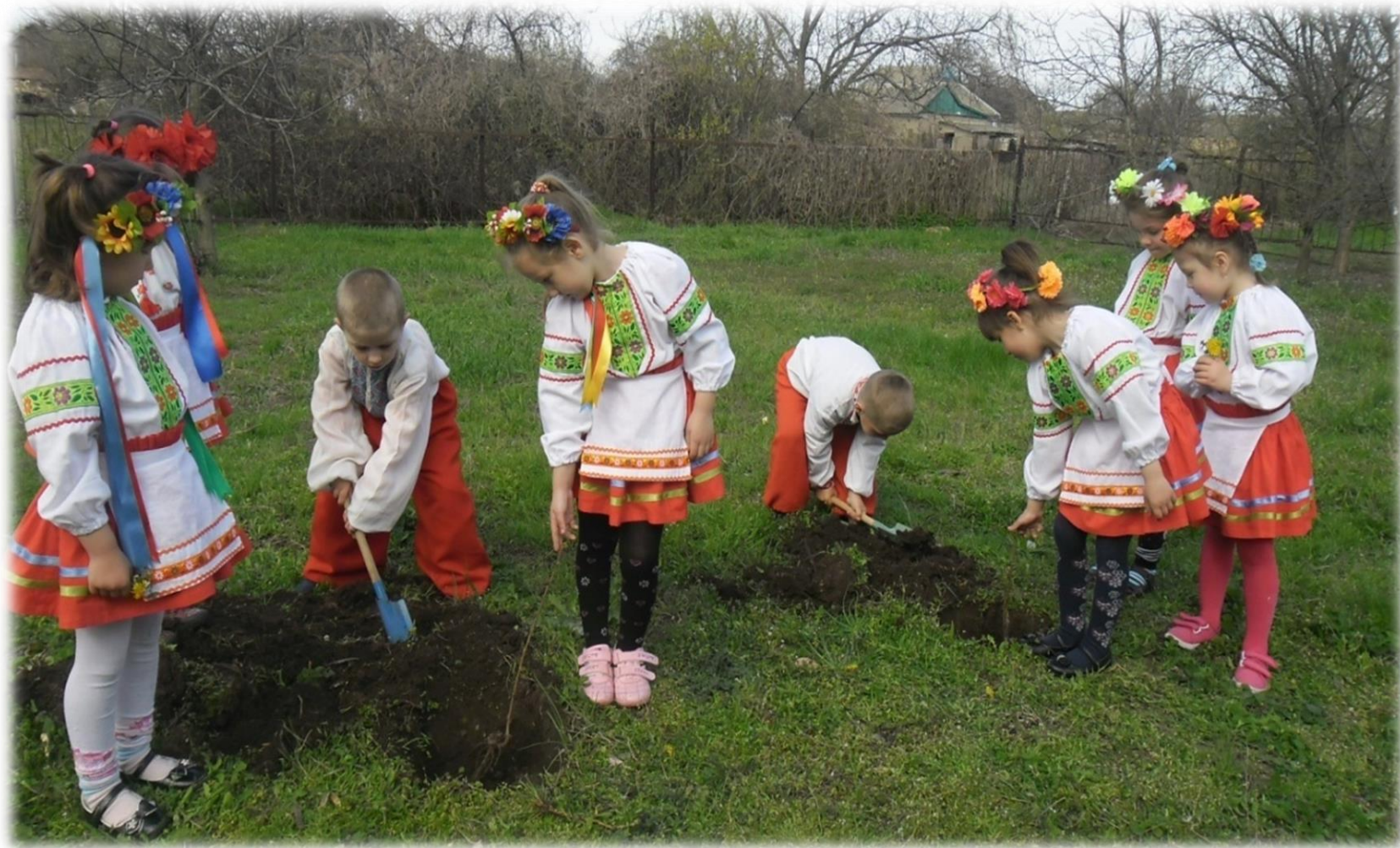
Вихованці ДНЗ №1 «Малятко» Снігурівської районної ради садили вишні з піснями та віршами