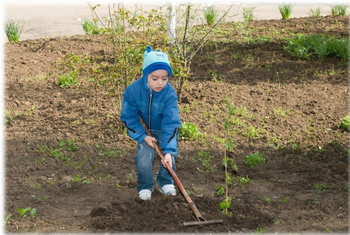
Висадження калини вихованцями дошкільного навчального закладу № 103 м. Миколаєва «Берегиня»