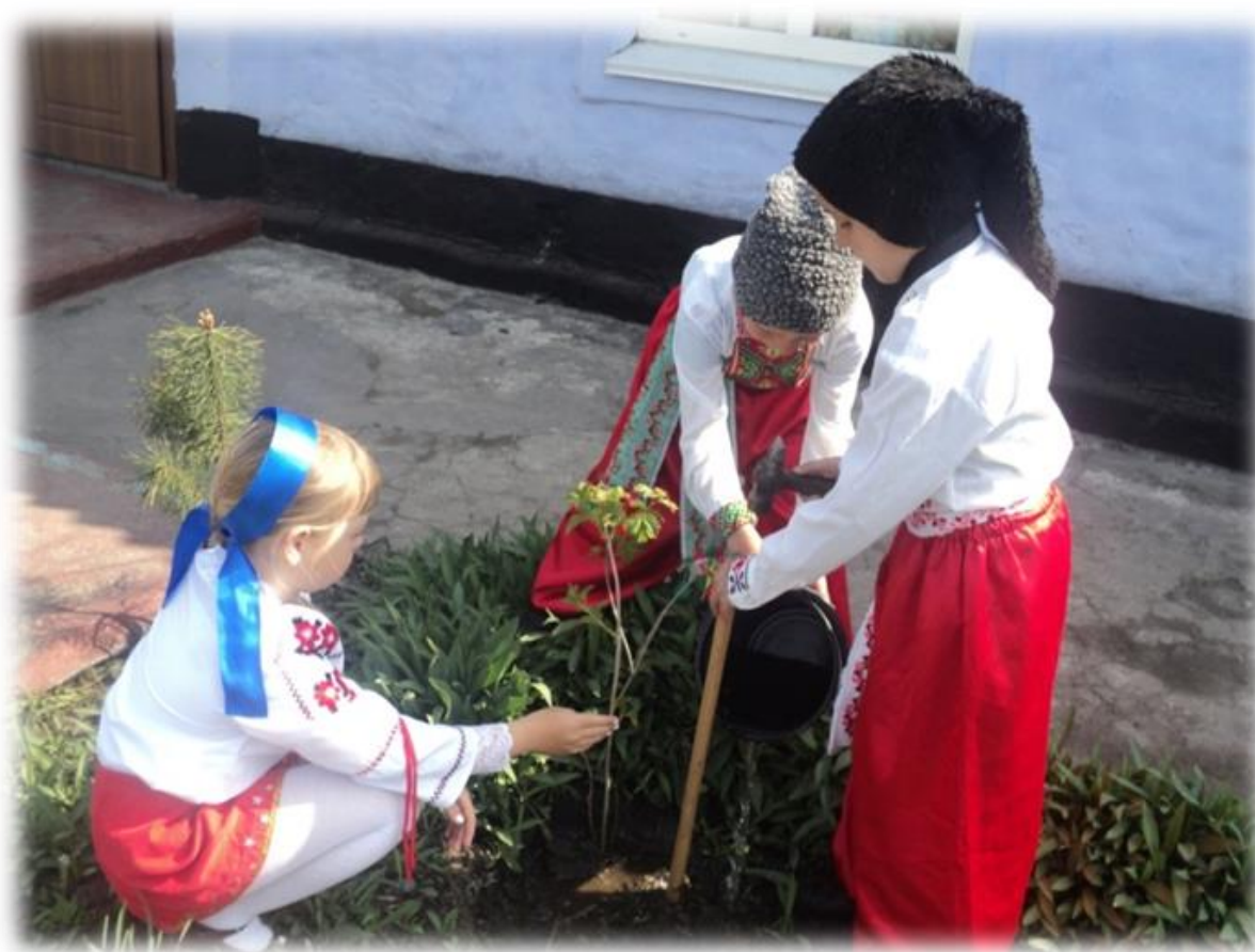
Висадження калини в Червонянській ЗОШ І– ІІ ступенів Вітовської районної ради Миколаївської області