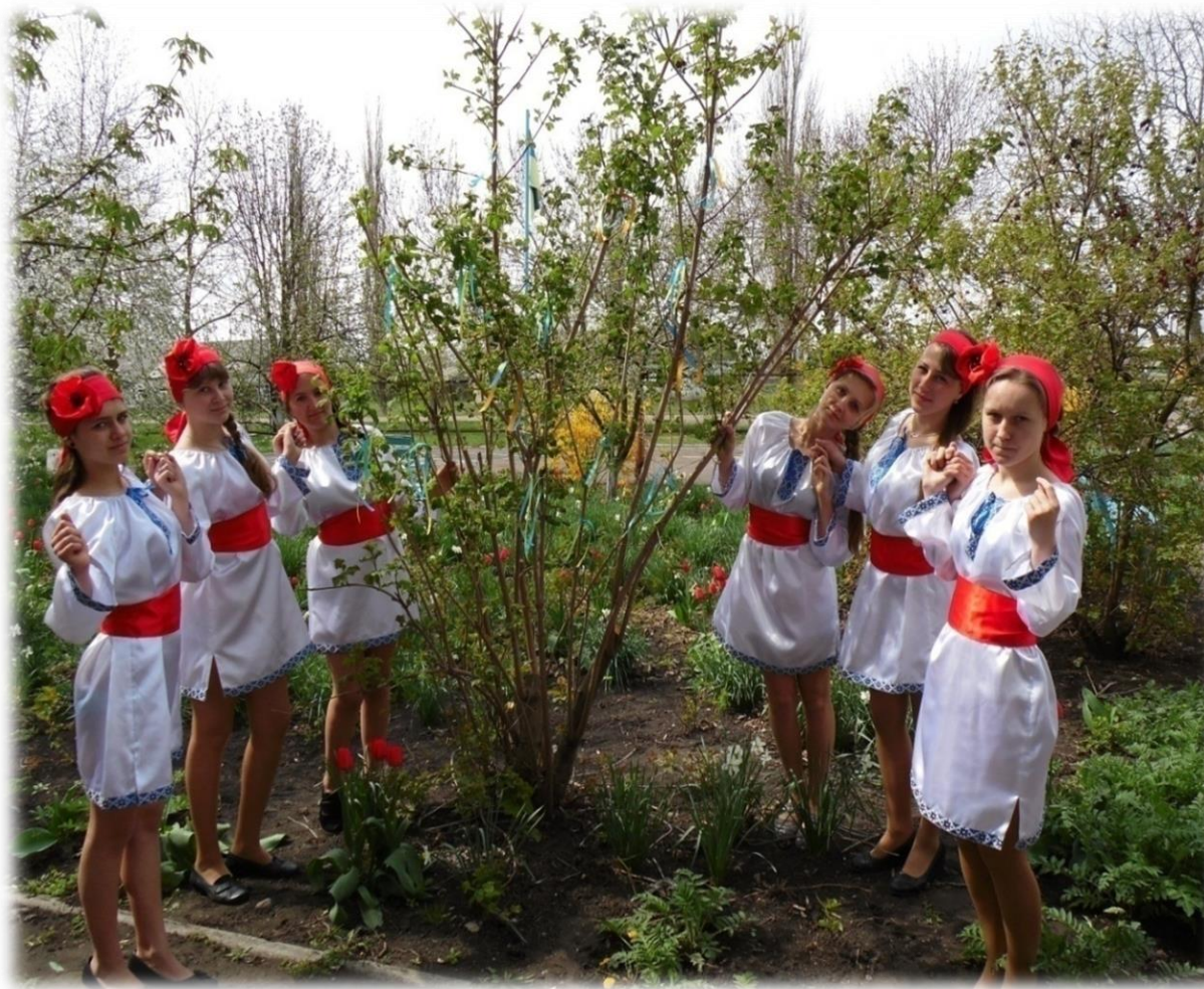
Флеш-моб з висадження калини в Михайлівській ЗОШ І–ІІІ ступенів Новоодеської районної ради Миколаївської області