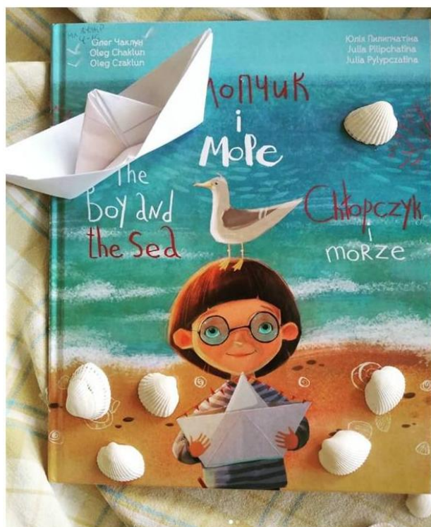
bibliotekadityachamykolaiv Миколаївська Обласна Дитяча Бібліотека