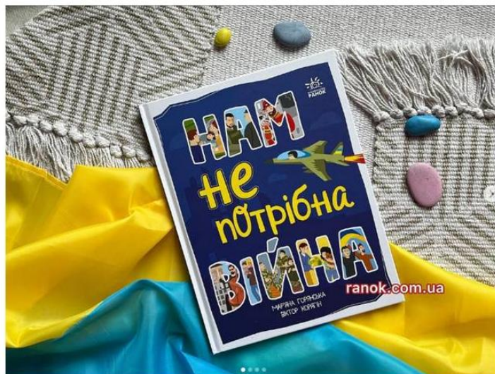
ranok.com.ua Інтернет-магазин "Ранок"