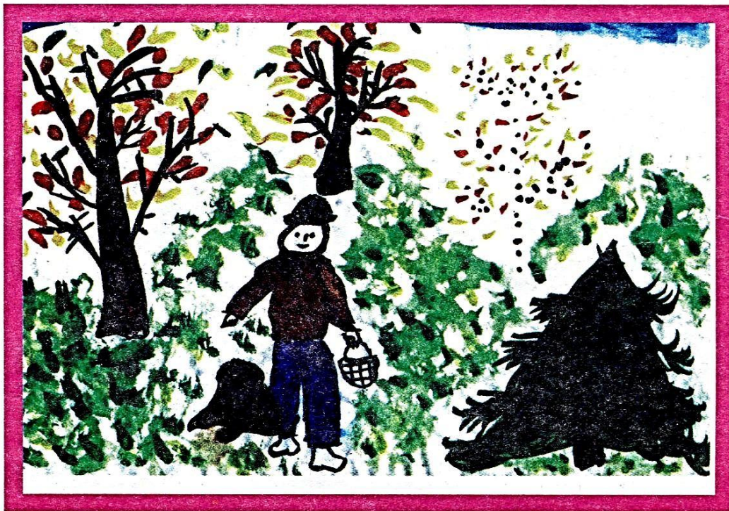
“По гриби” - Кравченко Маша, 6 років (ДНЗ № 87)