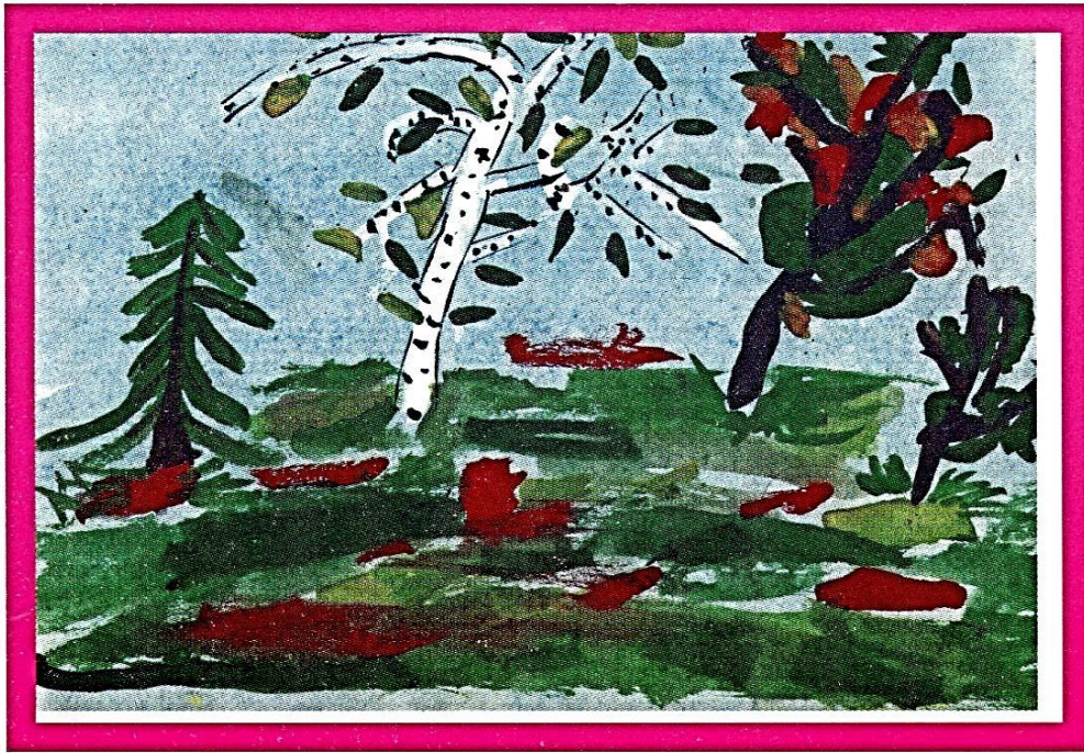
“Барви осені” - Трутень Олександр, 5 років (ДНЗ № 84)