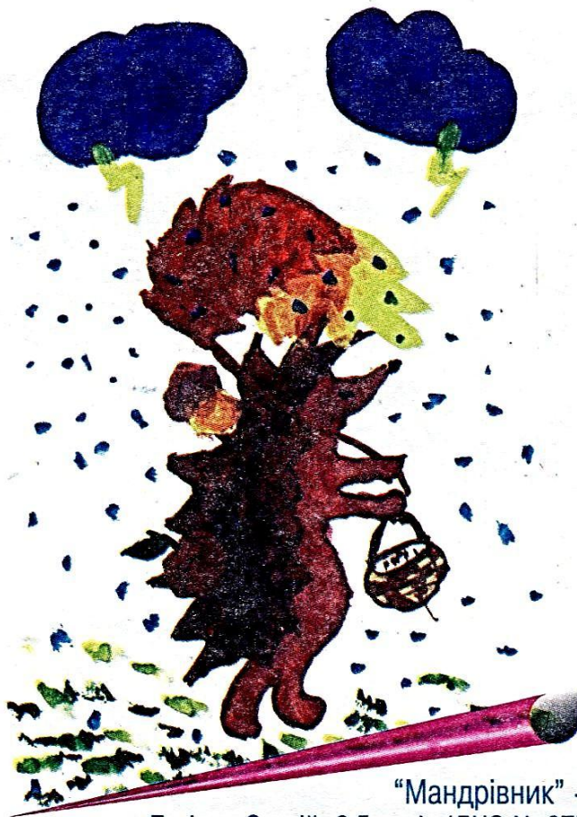
“Мандрівник” - Багіров Сергій, 6,5 років (ДНЗ № 87)