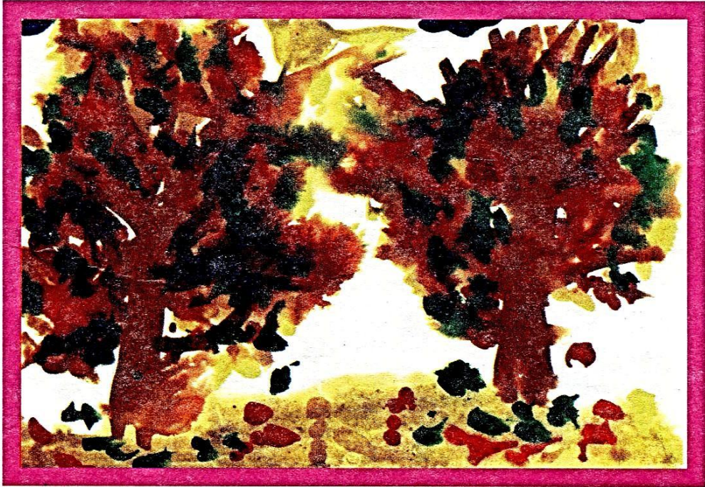
“Золота осінь” - Бузнік Надія, 6 років (ДНЗ № 84)